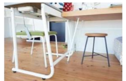
家具の足は全てスチール製。テーブルの台はかみ付けない厚さに。