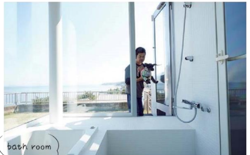
bath room ワンちゃんは庭から直接イン！シャンプー台があるので、お風呂タイムがとっても楽。タイルも滑りにくいものをセレクト。

動線やインテリア選びに犬の目線をプラスすることで、ワンちゃんと心通い合う時間を、もっとつくることができそうですね。