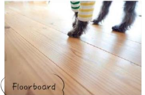
Floorboard フローリングは滑りや傷付きやすいのが難点。滑りにくい無垢材の浮き造りや、傷にも強いガラスコーティング仕上げがgood。

掃き出し窓を開けると、ワンちゃんたちは、庭へ一目散。塀の外は海になっているので、ご近所への迷惑も気になりません。