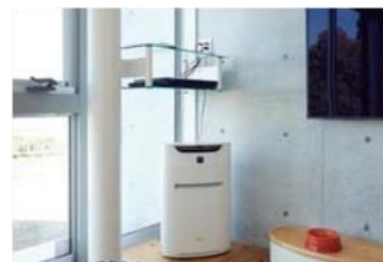
コードで遊ぶと感電してしまう恐れがあるので、コンセントを高い位置に設置すると安全。

ワンちゃんの安全のため、2階に上がれない階段ドアを設置。年を取って視力が落ちるとぶつかりやすいので、階段下と柱は丸いフォルムに。